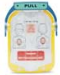
Cartouche d'électrodes de simulation pour nourrissons/enfants Référence M5074A