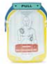
Cartouche d'électrodes de simulation pour adultes Référence M5073A

Le kit de formation pour instructeur (M5066-89100) comprend des supports de formation tels qu'une cassette vidéo et un CD-ROM avec une présentation PowerPoint, pour former des groupes à l'utilisation des défibrillateurs HeartStart OnSite et HeartStart FR2+.