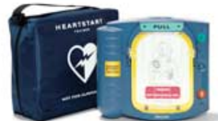
Simulateur HeartStart Référence M5085A