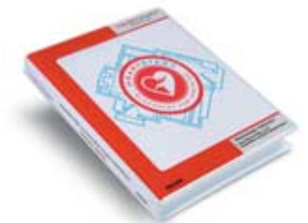
Kit de formation pour instructeur Référence M5066-89100